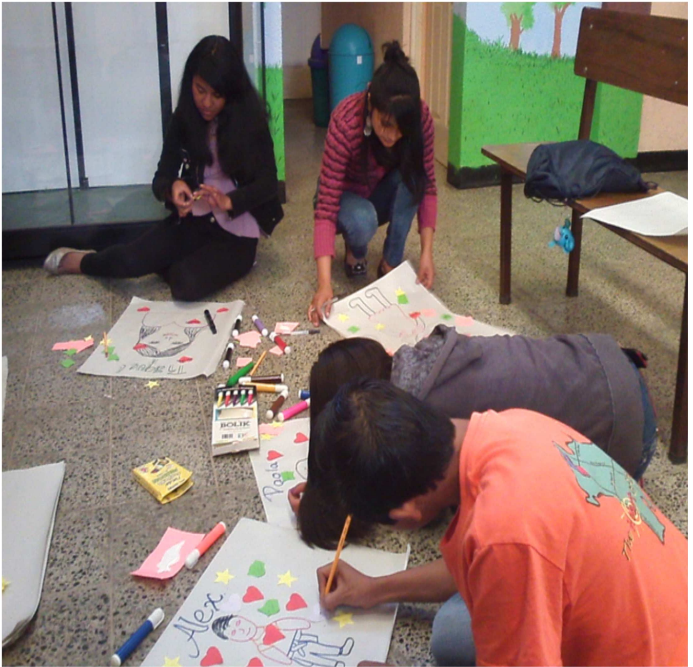
Taller de Autoestima con grupo de jóvenes del municipio de La Esperanza, Quetzaltenango.