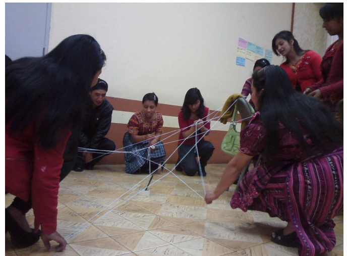
Taller de Autoestima con grupo de jóvenes de Totonicapán.