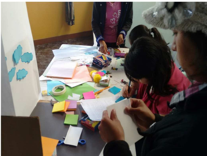
Taller de elaboración de maqueta y video stop motion, utilizando TIC's.